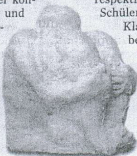
Hockende Figur – die Arbeit eines Zehntklässlers